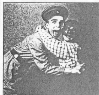
Ein wildes Puppenspiel um die Macht im Lande: Kaiser Wilhelm II. streitet mit Reichspräsident Friedrich Ebert