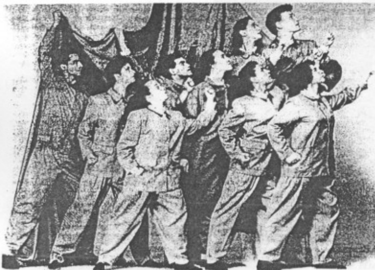
November 1918/1989. Das Theater der Klänge bedient sich intelligent der Mittel des Agit Prop