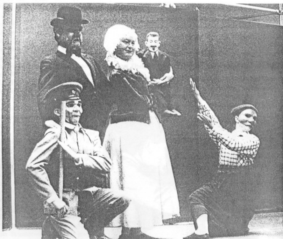
Theater der Klänge